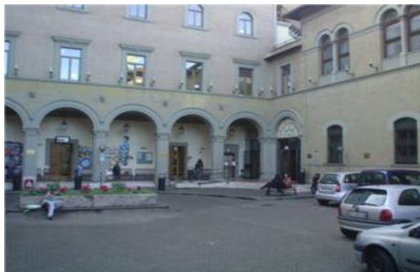
La Facoltà di Scienze della Comunicazione. Il calendario didattico 2008/2009 è consultabile sul sito della Facoltà www.comunicazione.uniroma1.it